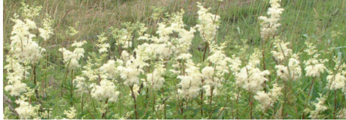
Hochstaudenflur mit Mädesüß

Entlang von Wegen und Gräben des Ochsenmoores blühen im Hochsommer viele bunte Kräuter, die typisch für ein Feuchtgebiet sind. Darunter finden sich auch Arten der sogenannten „Feuchten Hochstaudenflur“- hochwüchsige Pflanzen, die auf feuchten bis nassen Böden gedeihen. Da sie auf Mähen und Beweidung empfindlich reagieren, kommen sie vor allem dort vor, wo dies nur selten geschieht. Ab und zu wachsen sie auch auf feuchten Wiesen, die spät, d.h. ab Juli, gemäht werden.