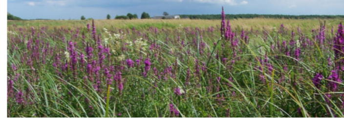
Wegrand mit Blutweiderich

6 Der Blutweiderich ( Lythrum salicaria ) gibt den Wegrändern mancherorts eine rote Färbung. Man findet drei verschiedene Blütentypen, die auf unterschiedlichen Pflanzen vorkommen. Sie sind so gestaltet, dass jeweils unterschiedlich lange Staubfäden und Griffel verhindern, dass sich die Pflanze selbst bestäubt. Der Blutweiderich wird gern von Schmetterlingen, aber auch von Bienen und Schwebfliegen besucht. Die Bezeichnung „Weiderich“ geht auf die schmale Blattform zurück, die an Weidenblätter erinnert.